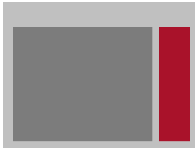
Skyscraper - 160x600 Pixel