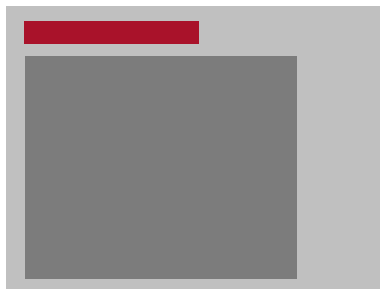
Full Size Banner - 468x60 Pixel